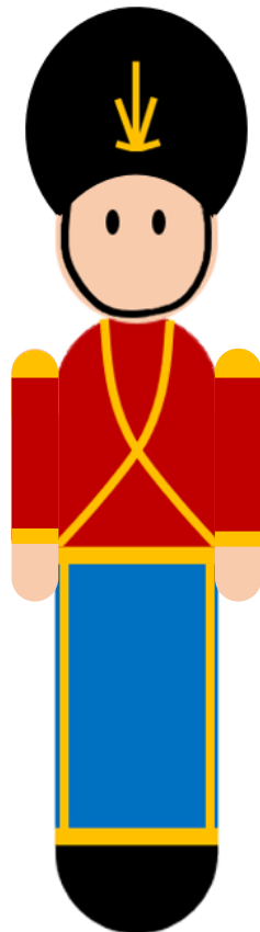
Skitse nr. 6

Sy en arm fast på hver side af kroppen (langs den røde del) som vist på skitse 6 nedenfor.